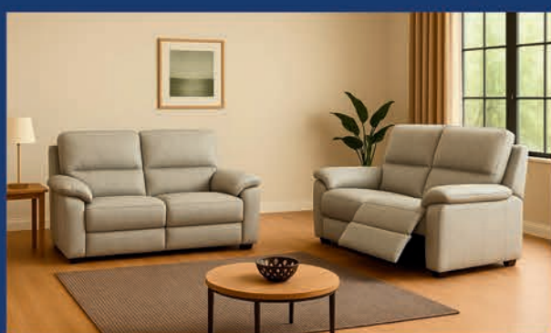
Salon cuir véritable 3 Places 2 relax électriques + 2 Places fixe