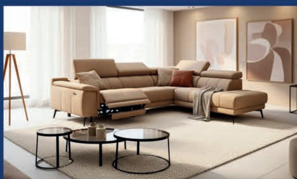
Salon d'angle tissu avec relax électrique : canapé 3 places + méridienne