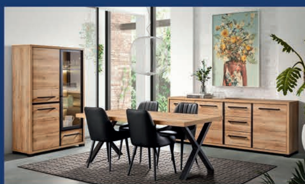
Salle à manger style industriel Dressoir 241 cm/Vitrine/Table 200 cm/4 chaises