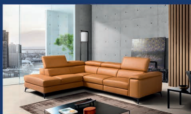
Salon design cuir véritable 3 places relax électrique + méridienne