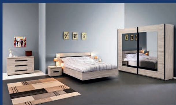
Chambre à coucher moderne ton chêne graphite : Lit 160 /2 chevets/garde-robe 200 cm/commode