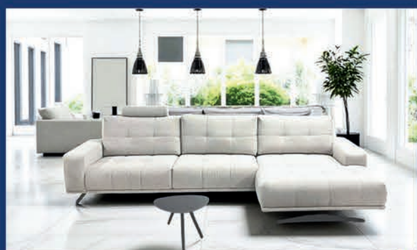
Canapé chaise longue design 3 places + large chaise- longue (tissu)

Ouvert tous les jours en période de SOLDES - Ouvert aussi les dimanches après-midi (Sauf le 21 juillet)