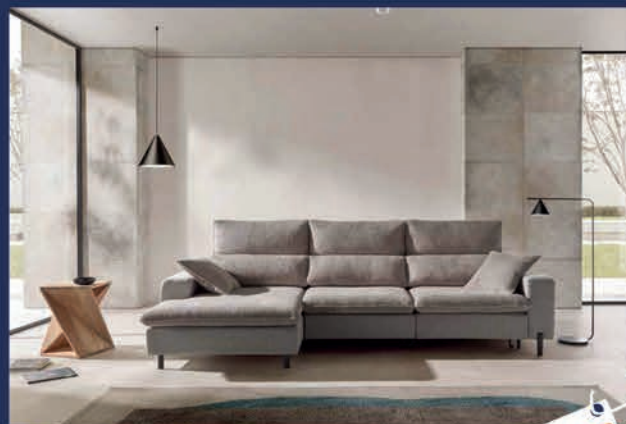
Salon tissu à assises avançantes Canapé 3 places + chaise longue chaque assise est coulissante y compris la chaise longue avec dossier relax