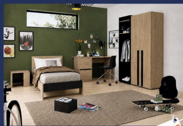
CHAMBRE DE JEUNE Ton chêne naturel + noir Lit 90 cm/chevet/ garde 3 éléments/bureau