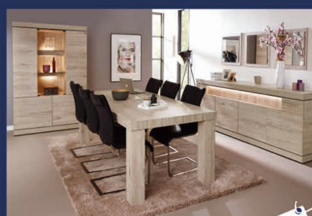
Salle à manger design

Ton chêne gris Dressoir 4 portes/Bar/Table 226 cm/4 fauteuils