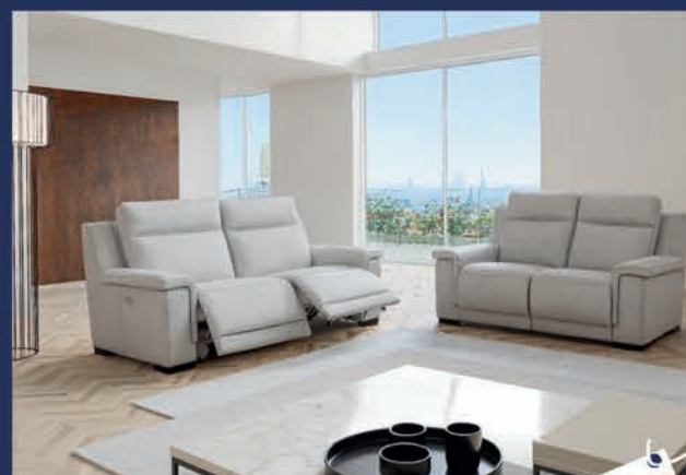
Salon cuir avec 2 relax électriques Canapé 3 places + 2 places