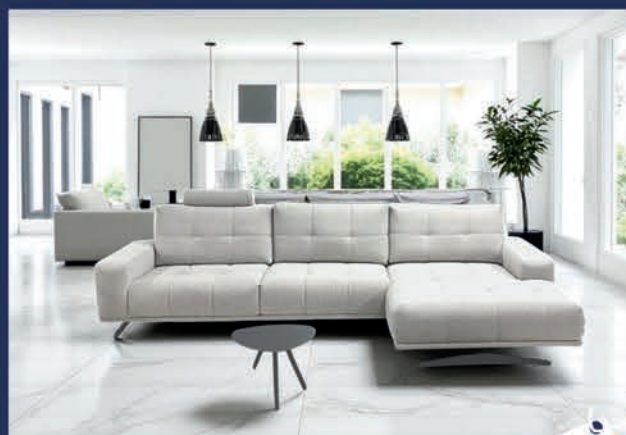
Canapé chaise longue design tissu 3 Places + large chaise longue