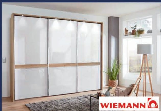
WIEMANN Nous proposons un très grand choix de modèles du célèbre fabricant allemand de chambres et d'armoires modulables. Venez avec vos dimensions, nous vous réaliserons votre projet sur ordinateur.