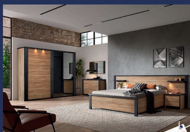
Chambre à coucher style industriel

Ton chêne naturel + noir Lit 160 x 200 cm/2 chevets + éclairages/ Garde-robe 2P coulissantes 220 cm/Commode