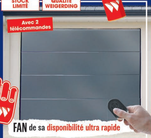
Avec 2 télécommandes