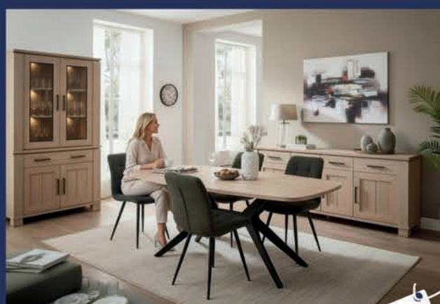
Salle à manger néo-classique

Ton chêne naturel Dressoir 223 cm/Vitrine éclairage compris/Table 225 cm/6 chaises tissu