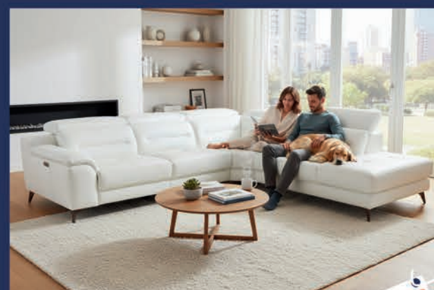
Salon d'angle design cuir relax Canapé 3 places relax électrique + méridienne