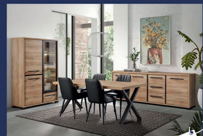
Salle à manger style industriel

Ton chêne clair Dressoir 241 cm/Vitrine éclairage compris/Table 200 cm/4 chaises