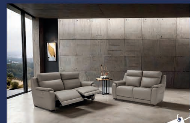
Salon cuir avec 2 relax électriques Canapé 3 places + 2 places