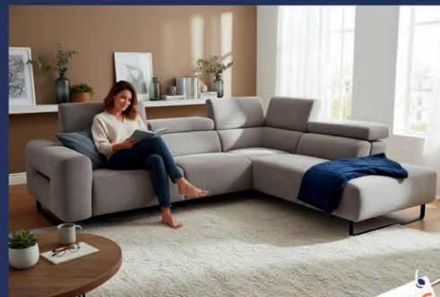
Salon design tissu pieds métal noir Canapé 3 places relax électrique + méridienne