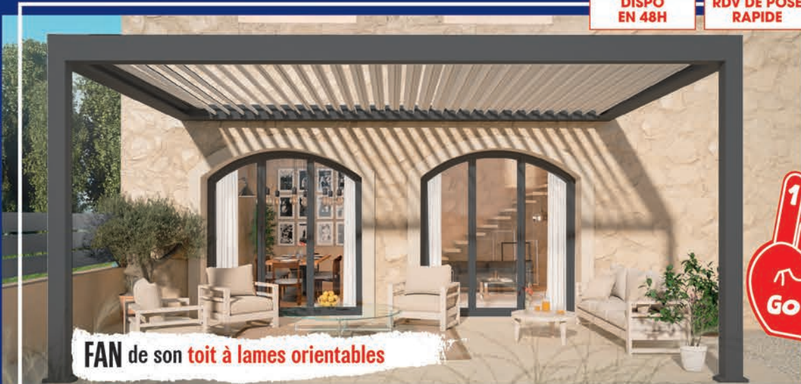
FAN de son toit à lames orientables

DISPO EN 48H RDV DE POSE RAPIDE STOCK LIMITÉ QUALITÉ WEIGERDING