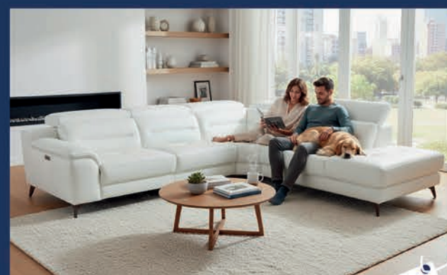
Salon d'angle design cuir relax Canapé 3 places relax électrique + méridienne