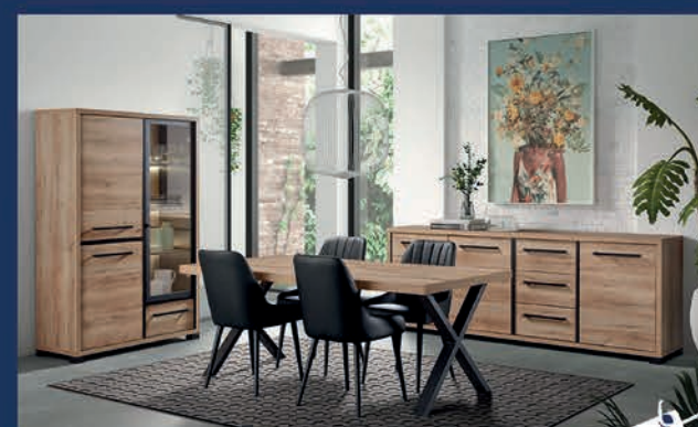
Salle à manger style industriel Ton chêne clair Dressoir 241 cm/Vitrine éclairage compris/Table 200 cm/4 chaises