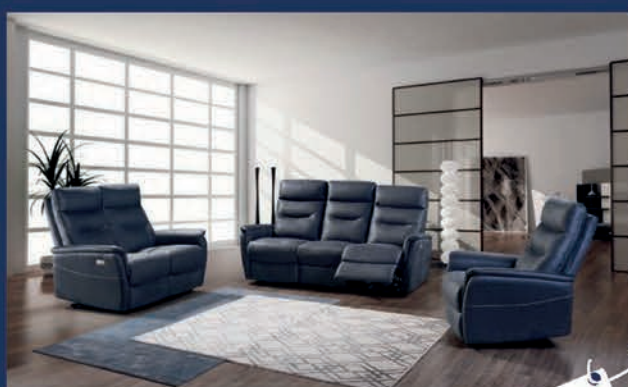
Salon en tissu avec 2 relax élec. Canapé 3 places + Canapé 2 Places

de -20% à -50% sur les prix déjà réduits