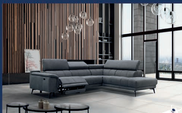
Salon d'angle tissu avec relax élec. Canapé 3 places + méridienne