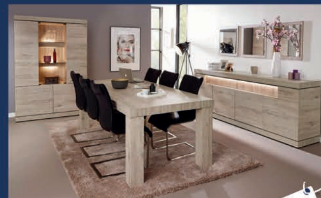
Salle à manger design Ton chêne gris Dressoir 4 portes/Bar/Table 226 cm/4 fauteuils