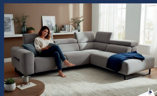
Salon design tissu pieds métal noir Canapé 3 places relax électrique + méridienne