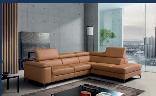
Salon d'angle design cuir relax Canapé 3 Places relax électrique + méridienne