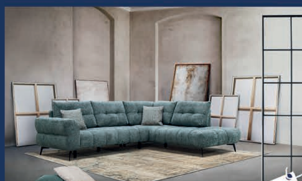
Salon d'angle design en tissu Canapé 3 places + méridienne gauche ou droite