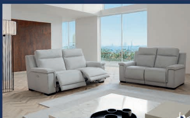
Salon cuir avec 2 relax électriques Canapé 3 places + 2 places