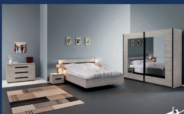
Chambre à coucher moderne Ton chêne graphite : Lit 160 x 200/ 2 chevets/garde-robe 200cm/ commode