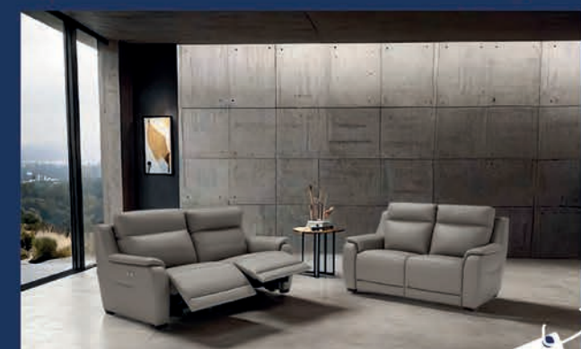
Salon cuir avec 2 relax électriques Canapé 3 places + 2 places