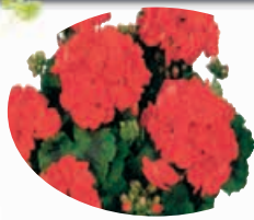
Zonals Barquette de 6 - Ø 10,5 cm

VENEZ VITE DÉCOUVRIR NOS FRAISES DE LONGUYON À CONSOMMER