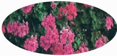
Géraniums Doubles Barquette de 6 - Ø 10,5 cm

GERANIUMS Rois du Balcon Groseille Barquette de 6 - Ø 9 cm