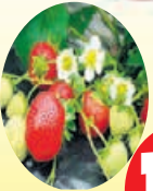
Fraisiers Les 12 pieds