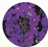
Verveine Barquette de 6 Ø 9 cm